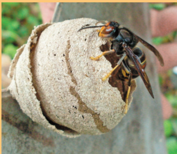
Frelon asiatique sur nid primaire