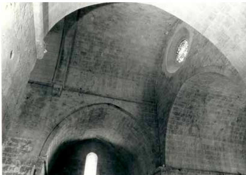
1971 : croisée de transept