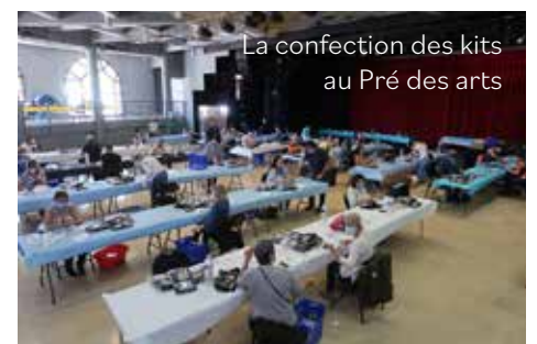
La confection des kits au Pré des arts

Il y a 6 ans, en mai 2020, Valbonne Sophia Antipolis, comme le monde, vivait la fin du premier confinement pendant la pandémie de Covid-19. Parmi les nombreux épisodes de cette crise sanitaire, l'épopée des masques, devenue une aventure solidaire, a marqué les esprits. Extrait de L'Info 417 : Afin de réceptionner les masques dans les temps pour les distribuer dans les boîtes aux lettres et aux habitants, le responsable de la Police Municipale effectue le trajet Valbonne-Lyon vendredi 1 er mai pour acheminer sans délai la commande de 15 000 masques grand public passée par la Commune. Plus de quarante volontaires se sont réunis au Pré des Arts lundi 4 mai, dans le respect des règles d'hygiène. Agents, élus et membres de la sécurité civile ont confectionné 15 000 kits composés d'un masque grand public et d'une notice. 9 170 masques supplémentaires ont été remis en main propre sur six points stratégiques de la commune en accès piéton ou voiture.